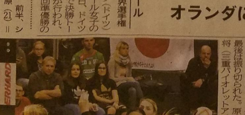
前回の優勝のオランダ