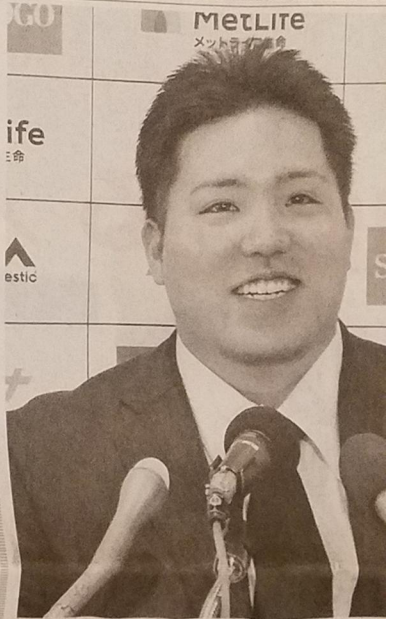
契約更改交渉を終え、記者会見する大谷翔平選手。12日、埼玉県所沢市のメットライフスタジアム

「相手の心理を奪え、駆け引きし、勝負を敢行にかけた」と手心えを握った。準々決勝に向けて「レベルが高い相手になるが、しっかりと気を引き締めて自分のプレーをし、勝ちたい」と意気込みを述べた。(編集部記者)