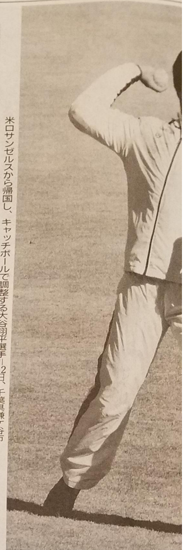
米ロサンゼルスから帰国し、キャッチボールで調整する大谷翔平選手。12日、千葉県鎌ヶ谷市